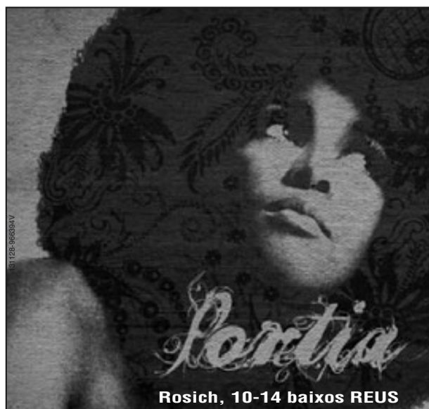
Rosich, 10-14 baixos REUS

● Reus. El Consell del Baix Camp i la secretaria de Joventut ofereixen un curs adreçat als dinamitzadors juvenils, que comença avui. Les sessions seran itinerants a Cambrils, Mont-roig i la Selva del Camp, i hi ha dotze places. El curs està pensat per reformular conceptes i estructurar la feina del dinamitzador.